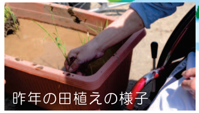
昨年の田植えの様子