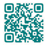
厚生労働省 障害福祉のお仕事の世界ホームページ